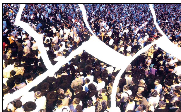
תרבות של יד איש באחיו הורסת אותנו מבפנים

האם אנו רוצים לחיות בעולם שאין בו כבוד האדם, אין בו הערכה לציבורים גדולים ומכובדים, אין בו נימוס, איפוק ותרבות דיון?