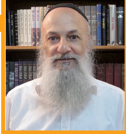
פעם בטבע, תמיד בטבע. טוסון

תורת החסידות דורשת, לפני התוכחה, 'לקצץ את הציפורניים', שלא לדקור, כי בציפורניים מצטבר זיהום, וכלשון הזוהר "בטופרה אחידן" [הקליפות נאחזות בהן]. אחרי נטילת הציפורניים צריך 'נטילת ידיים', שהיא המשכת ה'מוחין' למידות', שלא לפעול ולדבר מתוך נטיית הלב, אלא עליפי הכוונת המוח.