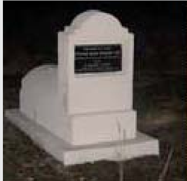
צינונו של רבינו בעיירה זיכלין שבפולין

באותו שבוע, כשהגיע ליל שבת, היה ביתו מוצף אורה ושמחה, והוא קידש על היין ואכל את מטעמי השבת, תוך כדי זמירות ותשבחות לבורא כל העולמים.