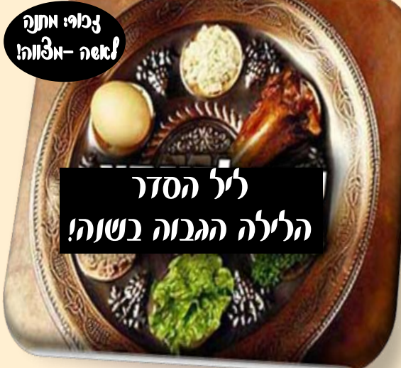
זכור: אתנה! אלוה!