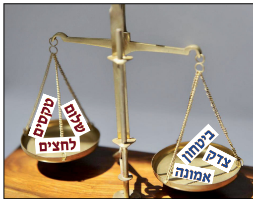
בלום עכשיו ולא לתלות תקוות במשאל עם עתידי

תפקידו של קברניט לנווט את הספינה הרחק מן השרטון המסוכן, ולא להניח לתהליכים הריאסון להבשיל וליהפך לדבר מוגמר